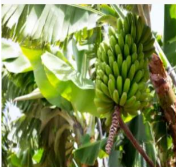
Coltivazione di banane canarie

Platano: il platano delle Canarie è il prodotto più esportato dell'arcipelago nonché una delle delizie tropicali più famose delle isole.