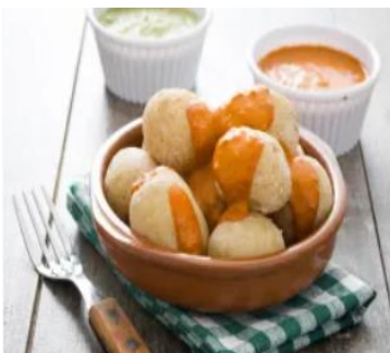
Patate con salsa "mojo"

Sebbene i piatti canari più famosi, come le patate o il mojo picón, non richiedano una lunga preparazione, racchiudono in sé un'identità unica, difficile da trovare altrove.