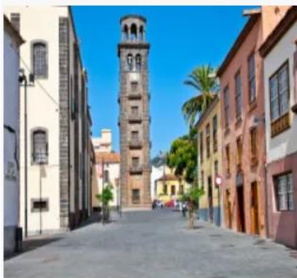
Campanile della chiesa della Concezione

Il tempio di La Laguna è anche la chiesa più antica di Tenerife, costruita all'inizio del XVI secolo in stile barocco. Senza dubbio, il suo elemento architettonico più importante è il campanile, che offre delle viste panoramiche eccezionali della città.