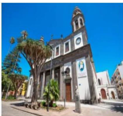
Cattedrale di La Laguna

Visitare La Laguna significa viaggiare nell'epoca di massimo splendore della storia di Tenerife. Le sue strade acciottolate e perfettamente allineate furono addirittura il